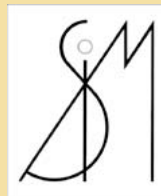
Società Italiana di Musicologia