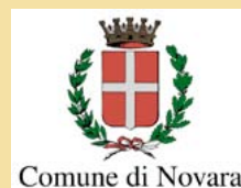
Comune di Novara